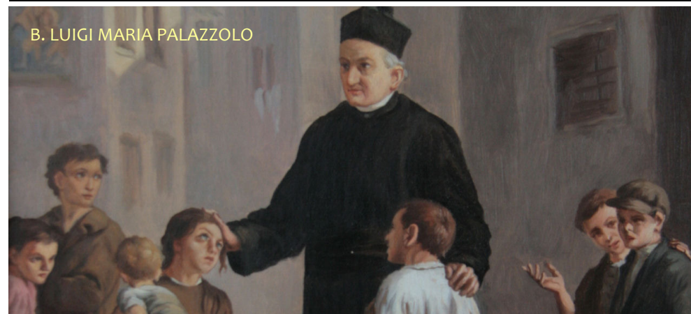
B. LUIGI MARIA PALAZZOLO