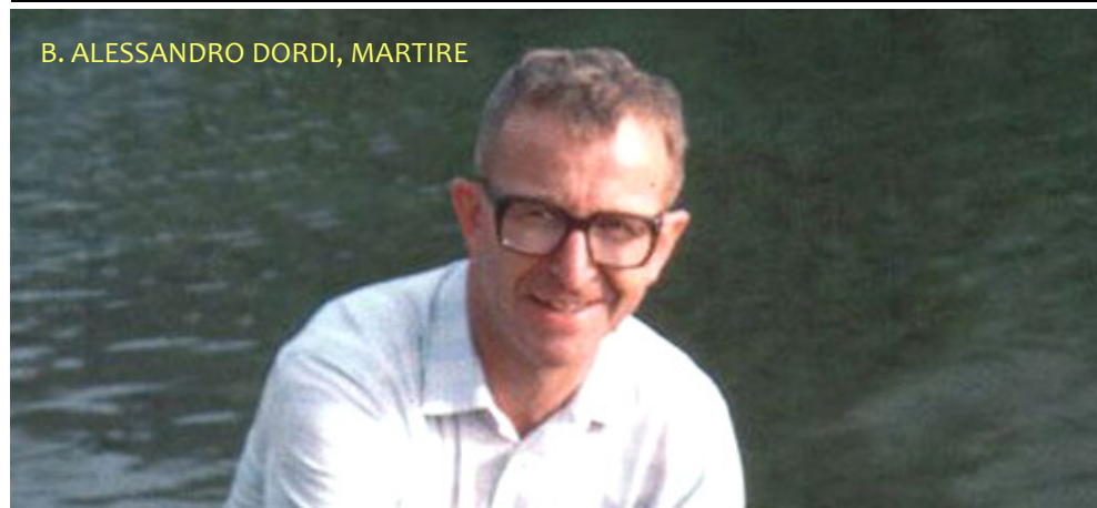
B. ALESSANDRO DORDI, MARTIRE