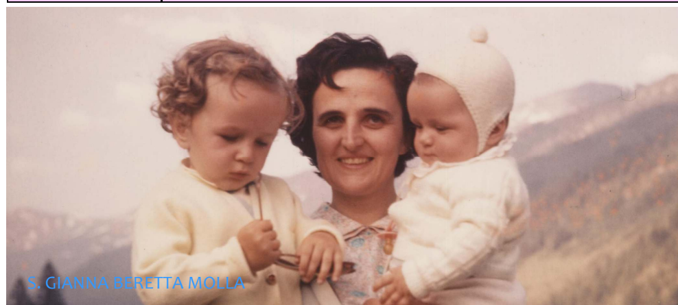
S. GIANNA BERETTA MOLLA