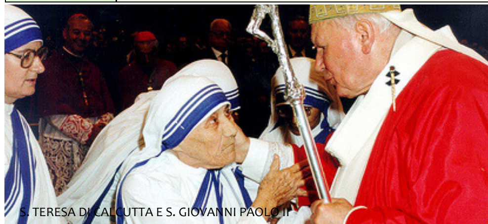
S. TERESA DI CALCUTTA E S. GIOVANNI PAOLO II