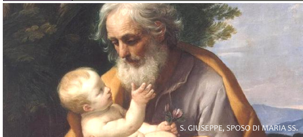
S. GIUSEPPE, SPOSO DI MARIA SS.