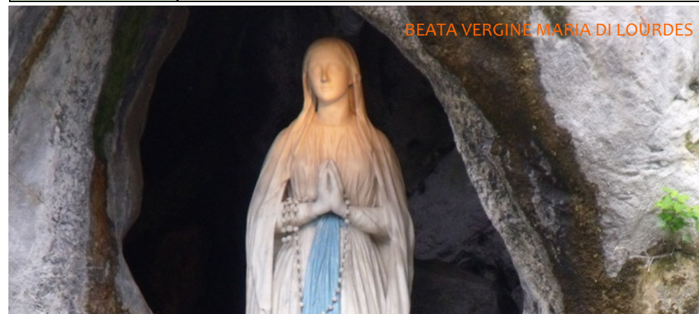
BEATA VERGINE MARIA DI LOURDES