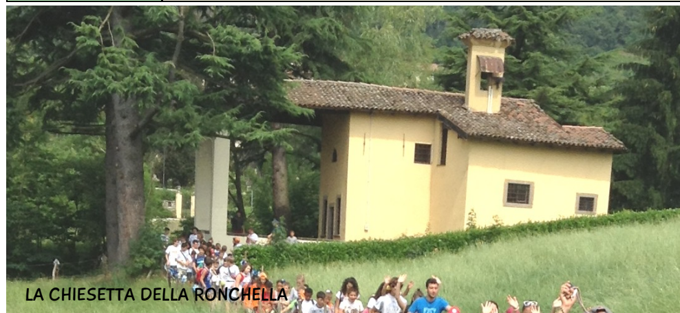
LA CHIESETTA DELLA RONCHELLA